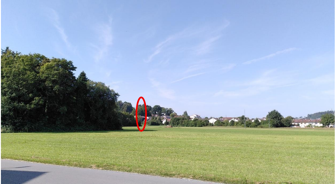
Abb. 9: Aufnahmeort Nr. 5, Blickrichtung Südwesten, ca. 500 m Entfernung zum Geltungsbereich