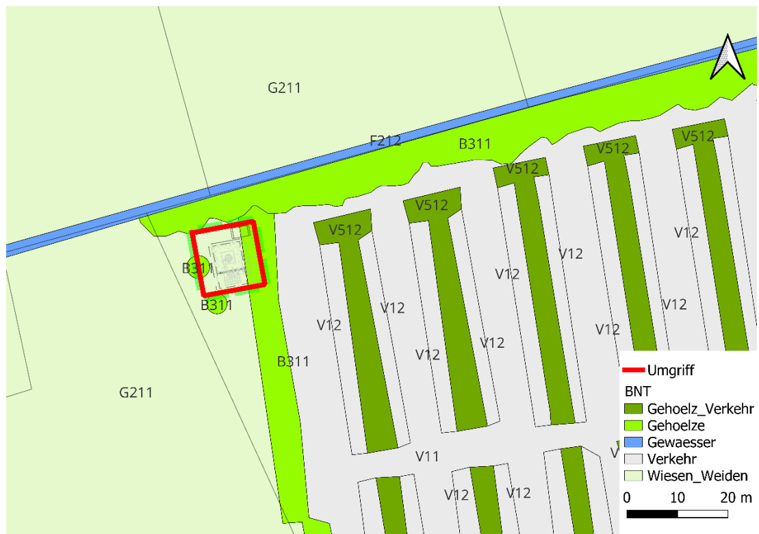
Abb. 3: Biotop-/Nutzungstypkartierung

vollständig versiegelten Fahrbahn (V11) mit wasserdurchlässigen gekiesten Parkbuchten (V12). Die Parkflächen sind durch Baumstreifen strukturiert, welche aufgrund ihrer Funktion und Lage als verkehrsbegleitende Gehölzstruktur (V512) eingestuft werden. Der Maststandort ist im Osten durch eine Baumreihe (B311) bestehend aus jungen Eschen ( Fraxinus excelsior ) unterpflanzt mit Schneeball ( Viburnum sp.), Lavendelweide ( Salix eleagnos ) und Hundsrose ( Rosa canina ) vom Parkplatz getrennt. Nach Norden grenzt eine weitere junge Baumreihe (B311) bestehend aus verschiedenen heimischen Arten den Maststandort sowie den Parkplatz an. Dahinter fließt ein Graben (F212) und dem dahinter liegend mäßig extensiv genutzte, artenarme Grünlandbestände (G211). Im Westen und Süden schließt an den geplanten Standort weiteres mäßig extensiv genutztes, artenarmes Grünland (G211) an.