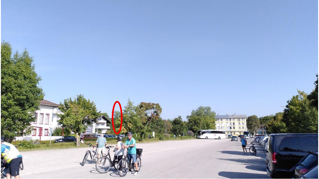
Abb. 7: Aufnahmeort Nr. 3, Blickrichtung Nordwesten, ca. 800 m Entfernung zum Geltungsbereich