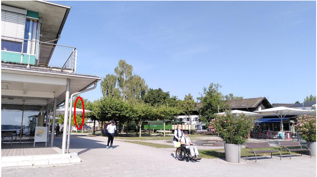
Abb. 5: Aufnahmeort Nr. 1, Blickrichtung Westen, ca. 800 m Entfernung zum Geltungsbereich