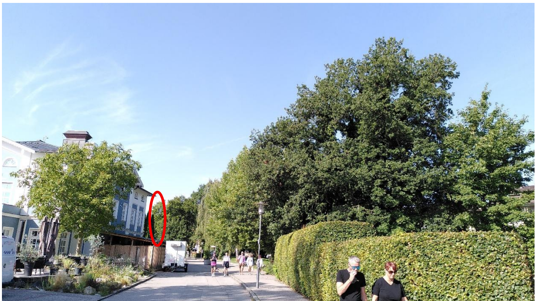
Abb. 6: Aufnahmeort Nr. 2, Blickrichtung Westen, ca. 800 m Entfernung zum Geltungsbereich