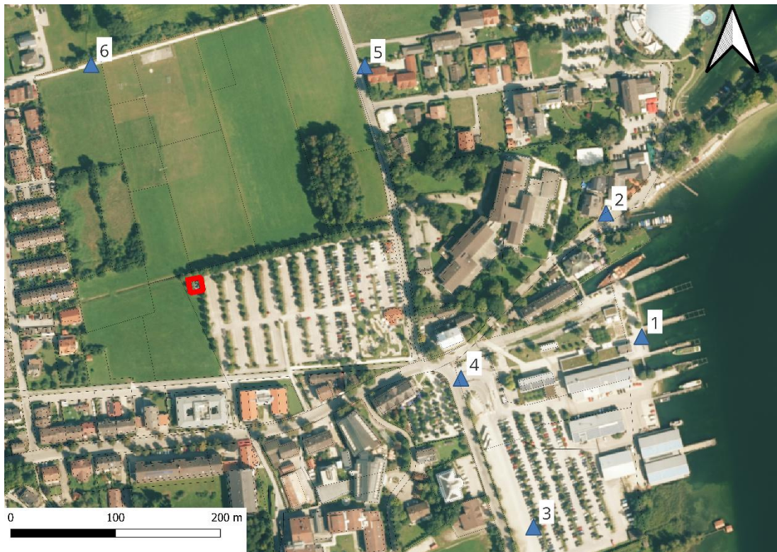
Abb. 4: Übersicht Fotostandorte

Hierzu wurden Aufnahmen von der Seepromenade sowie angrenzenden Bereichen mit Blickrichtung auf den Geltungsbereich angefertigt: