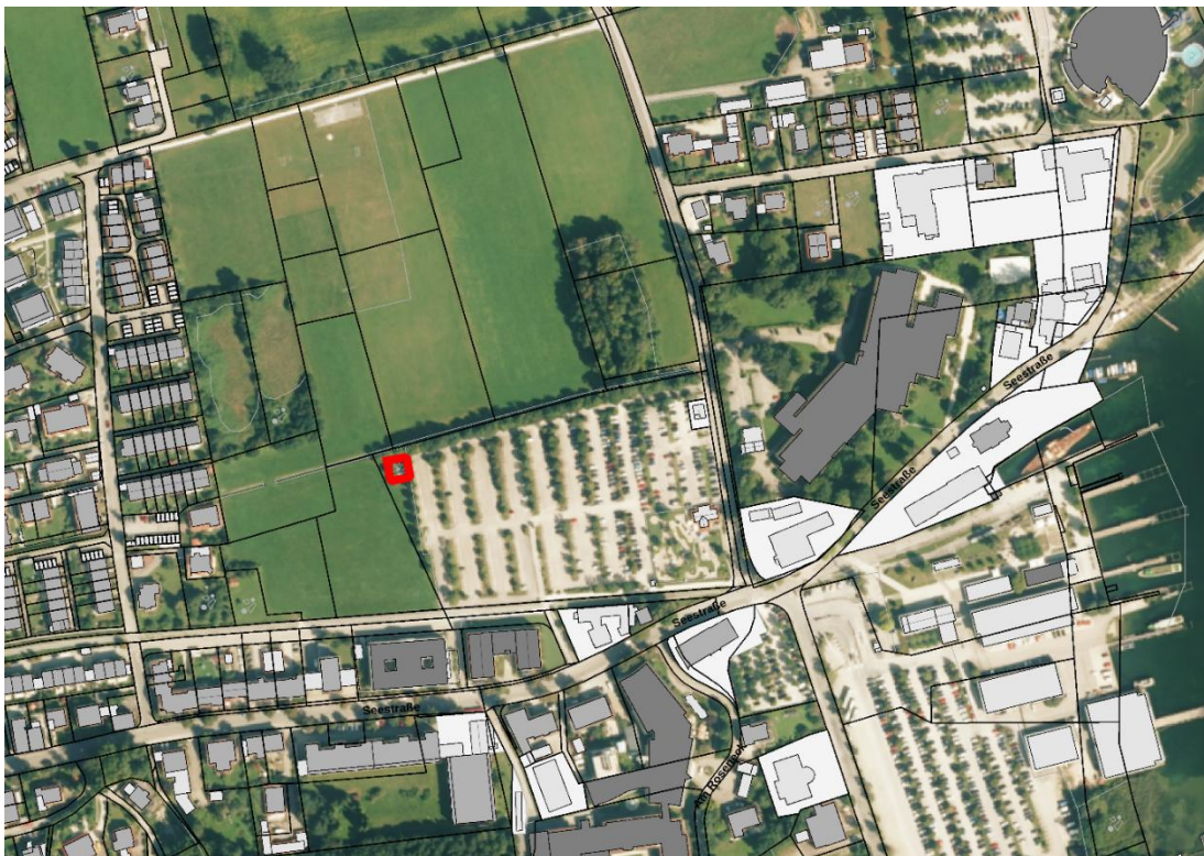
Abb. 1: Übersicht über die Lage und den Umgriff (rot) des Änderungsbereichs

Ca. 450 m Östlich befindet sich der Hafen Prien am Chiemsee und das Ostufer des Chiemsees. Westlich an den geplanten Maststandort schließen Grünflächen und nach ca. 100 m Wohnbebauung an. In ca. 100 m südlicher Entfernung verläuft die historische Eisenbahnlinie Prien am Chiemsee – Prien Stock südlich davon schließt weitere Siedlungsbebauung an. Nachfolgende Abbildung zeigt eine Übersicht: