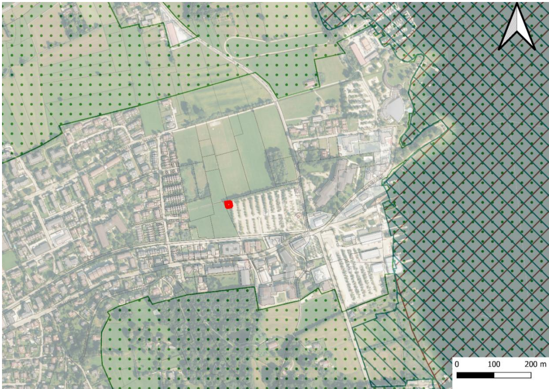
Abb. 2: Distanz des Planungsgebietes (rot) zu Schutzgebieten des Naturschutzes

Durch den Bereich des geplanten Maststandorts verlaufen keine gesetzlich geschützten Gebiete. Die nächsten Schutzgebiete sind das FFH- Gebiet „Chiemsee“ Nr. DE8140372 sowie das Vogelschutzgebiet „Chiemseegebiet mit Alz“ Nr. DE8140471 und das Landschaftsschutzgebiet LSG-00396.01 „Schutz des Chiemsees, seiner Inseln und Ufergebiete in den Landkreisen Rosenheim und Traunstein als LSG ("Chiemsee-Schutzverordnung)". Diese Schutzgebiete sind wichtige Lebensräume für viele Tier und Pflanzenarten. Es sind keine amtlich kartierten Biotope auf dem Plangebiet bekannt. Nachfolgende Abbildung zeigt die Lage im Kontext der umliegenden Schutzgebietskulisse auf: