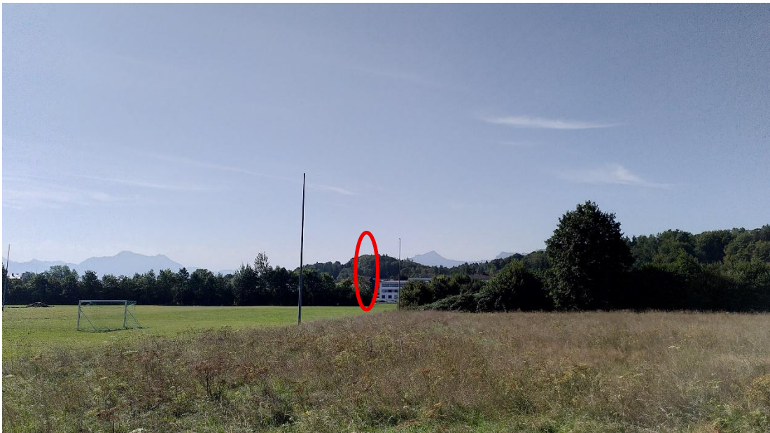
Abb. 10: Aufnahmeort Nr. 6, Blickrichtung Süden, ca. 500 m Entfernung zum Geltungsbereich