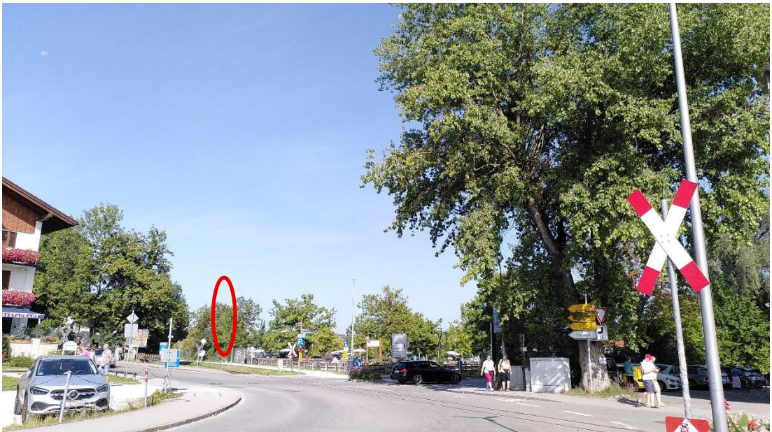
Abb. 8: Aufnahmeort Nr. 4, Blickrichtung Nordwesten, ca. 500 m Entfernung zum Geltungsbereich