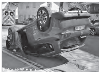
In der Priener Seestraße hatte sich ein Auto überschlagen.

aufmerksam gemacht, dass sich in unmittelbarer Nähe ein weiterer Notfall ereignet hatte: Eine Person war mit dem Fahrrad gestürzt und lag bewusstlos am Boden. Unverzüglich begaben sich Einsatzkräfte zur verletzten Person und übernahmen die medizinische Erstversorgung. Die betroffene Person wurde bis zum Eintreffen des Rettungsdienstes betreut und stabilisiert. Nach Übergabe an den Rettungsdienst konnten die Maßnahmen seitens der Feuerwehr abgeschlossen werden. red