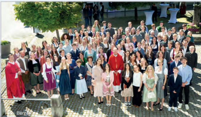
53 Firmlinge aus dem gesamten Pfarrverband erhielten das heilige Sakrament Ende April in der Pfarrkirche Mariä Himmelfahrt.