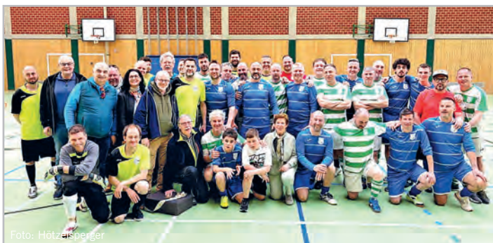
Gruppenfoto der »Priener Löwen« mit den Fußball-Gästen aus Valdagno.