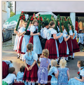
Tanz am Maibaum mit der Jugend- und Aktivengruppe vom Trachtenverein.

Am Samstag, 16. Mai laden der Trachtenverein GTEV Prien und der Markt Prien zum »Tanz am Maibaum«. Ab 16 Uhr erwartet Einheimische und Gäste ein buntes Programm aus heiteren Musikeinlagen und traditionellen Tänzen der Trachtler am Marktplatz. Mit bayerischen Schmanckerln und einem Getränkeauschank ist für das leibliche Wohl bestens gesorgt. Der Eintritt ist frei. red