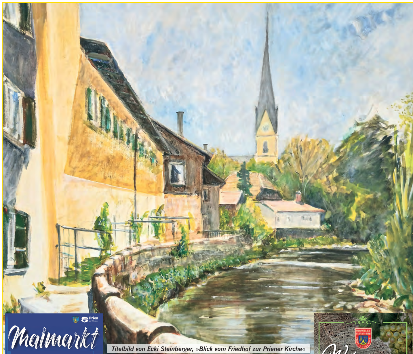
Titelbild von Ecki Steinberger, »Blick vom Friedhof zur Priener Kirche«

INFORMATIONSBLATT FÜR DEN MARKT PRIEN AM CHIEMSEE